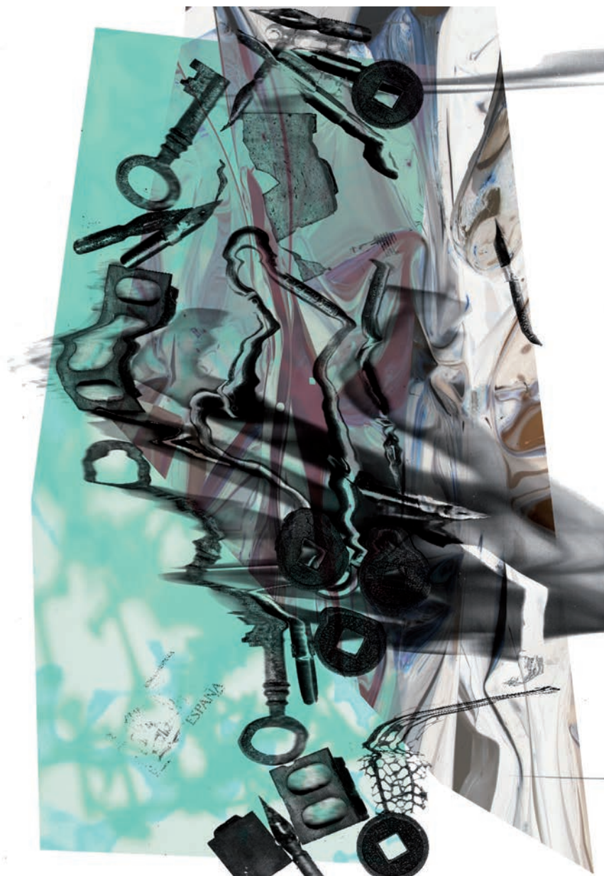
Serie Collage 70 x 100 cm. Impresión digital s/ papel.