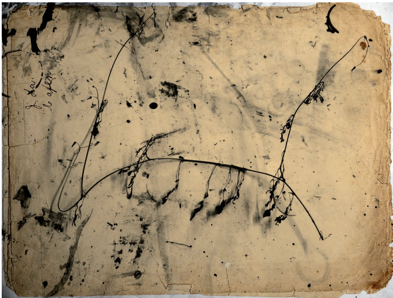
Flor muerta 70 x 50 cm. Impresión s/ aluminio.