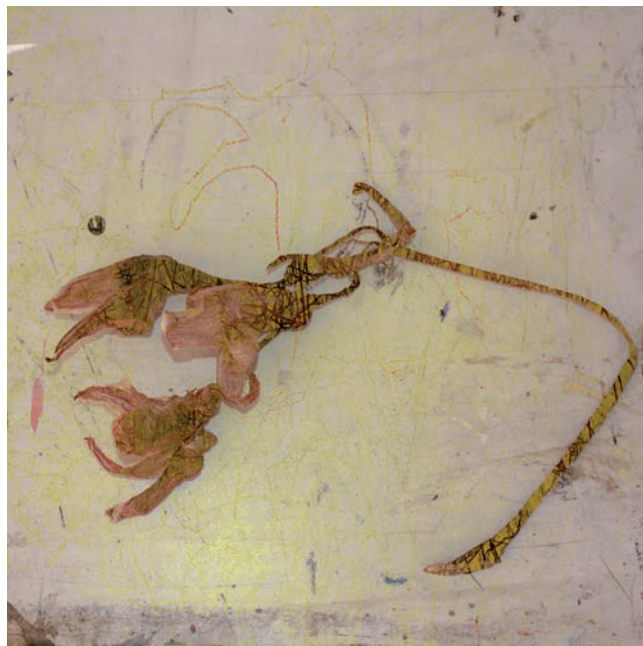
Serie Flores 50 x 50 cm. Impresión digital s/ papel.